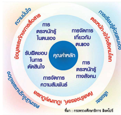
ภาพที่ 2 : กระบวนการเรียนรู้ที่จำเป็นในศตวรรษที่ 21

จากภาพจะแสดงให้เห็นว่ากระบวนการเรียนรู้ที่จำเป็นในศตวรรษที่ 21 นั้นสอดคล้องกับแนวทางการพัฒนาผู้เรียนในทางการศึกษาตามอรรถาธิบายในศตวรรษใหม่เพราะการที่จะทำให้ผู้เรียนเกิดคุณค่าหลักในตนเองจะต้องประกอบไปด้วยการจัดการเกี่ยวกับตนเองได้ การตระหนักรู้ในสังคม การจัดการความสัมพันธ์ การมีความรับผิดชอบและการตัดสินใจที่ตีรวมไปถึงการตระหนักรู้ในตนเอง ซึ่งเป็นคุณสมบัติที่สำคัญของผู้เรียนทางการศึกษาตามอรรถาธิบายด้วยเช่นกัน