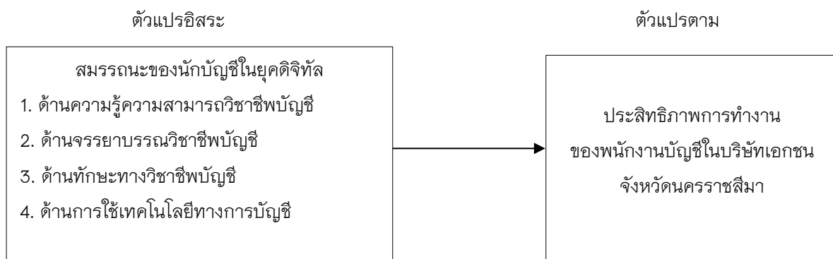
ภาพที่ 1 กรอบแนวคิดของการวิจัย

จากการศึกษาทบทวน แนวคิด ทฤษฎี และงานวิจัยที่เกี่ยวข้อง นำมาสู่การศึกษาสมรรถนะของนักบัญชีในยุค ดิจิทัลที่ส่งผลต่อประสิทธิภาพการทำงานของพนักงานบัญชีในบริษัทเอกชน จังหวัดนครราชสีมา มีกรอบแนวคิดของ การวิจัย ดังนี้