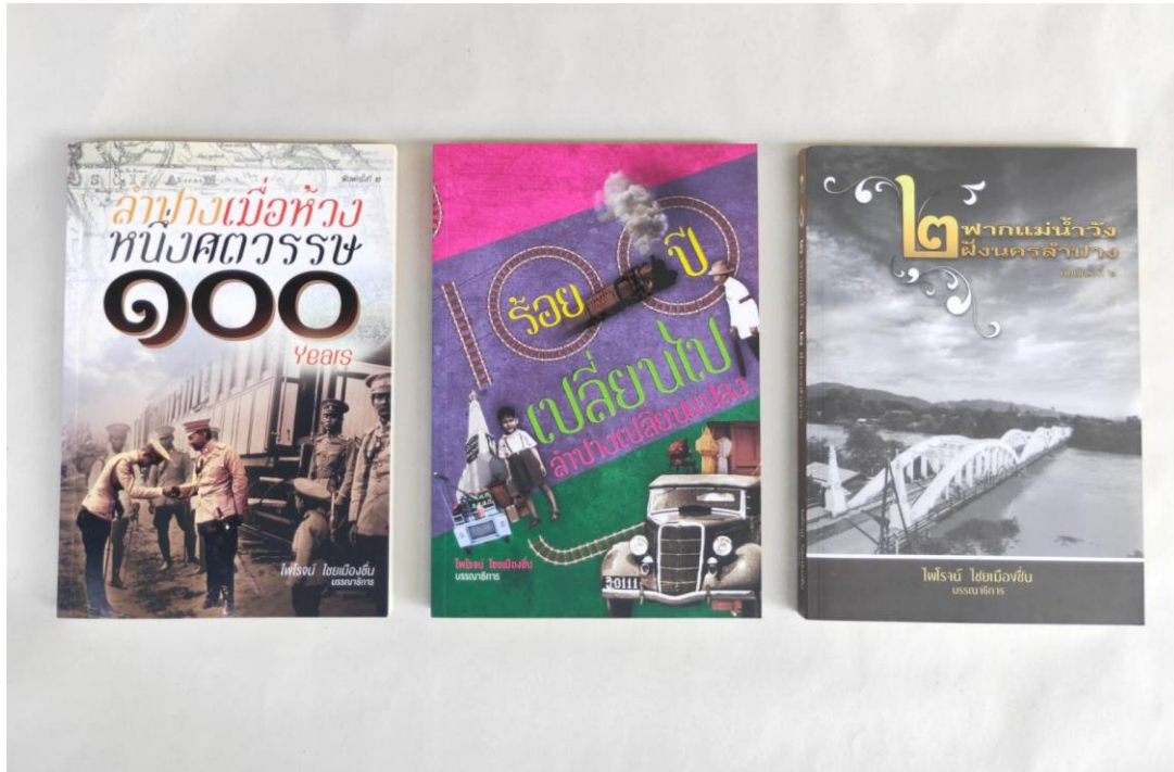
ภาพที่ 1 หนังสือชุดลำปางศึกษาจำนวน 3 เล่ม

เป็นระบบและมีความลึกซึ้งยิ่งขึ้น ตลอดจนจัดทำเป็นหนังสือประวัติศาสตร์เพื่อเผยแพร่ในสังคมท้องถิ่น เพื่อถ่ายทอดองค์ความรู้ ซึ่งจะทำให้เกิดการรับรู้ประวัติศาสตร์ท้องถิ่นได้อย่างกว้างขวางมากขึ้น ผู้สร้างสรรค์ในฐานะบรรณาธิการหนังสือรวมบทความทางวิชาการด้านประวัติศาสตร์ท้องถิ่นเห็นความจำเป็นที่ต้องสร้างความรู้ที่เกี่ยวกับประวัติศาสตร์และวัฒนธรรมของเมืองลำปางจึงได้ริเริ่มทยอยจัดทำหนังสือชุดลำปางศึกษาจำนวน 3 เล่มด้วยความตั้งใจที่จะสร้างความก้าวหน้าทางวิชาการด้านประวัติศาสตร์ท้องถิ่นโดยร่วมมือกับเครือข่ายนักวิชาการท้องถิ่น