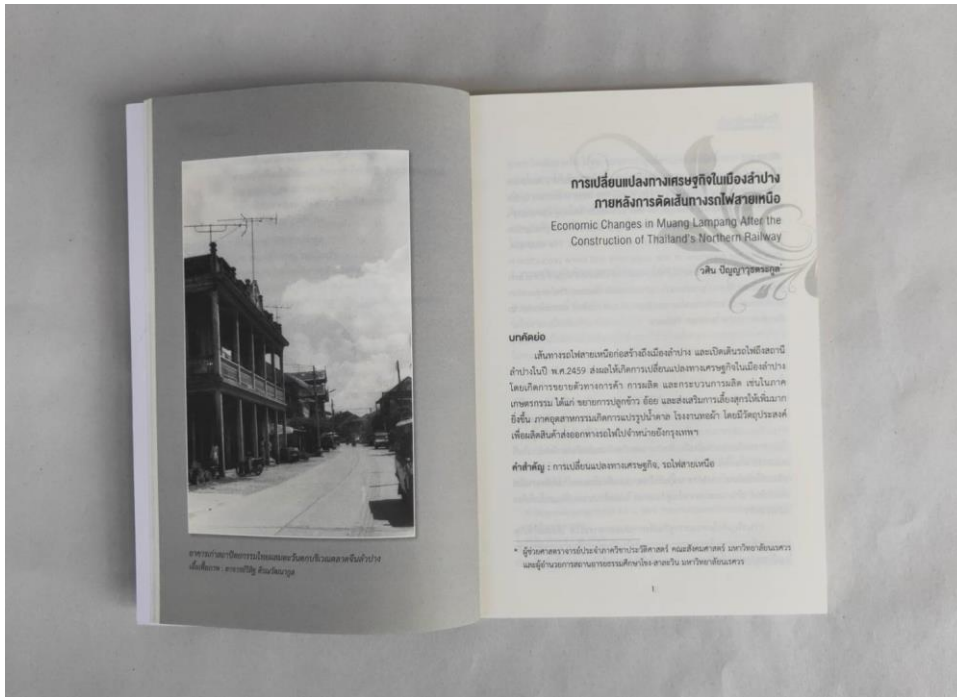
ภาพที่ 6 ตัวอย่างบทความในหนังสือเรื่อง “ร้อยปีเปลี่ยนไป ลำปางเปลี่ยนแปลง”