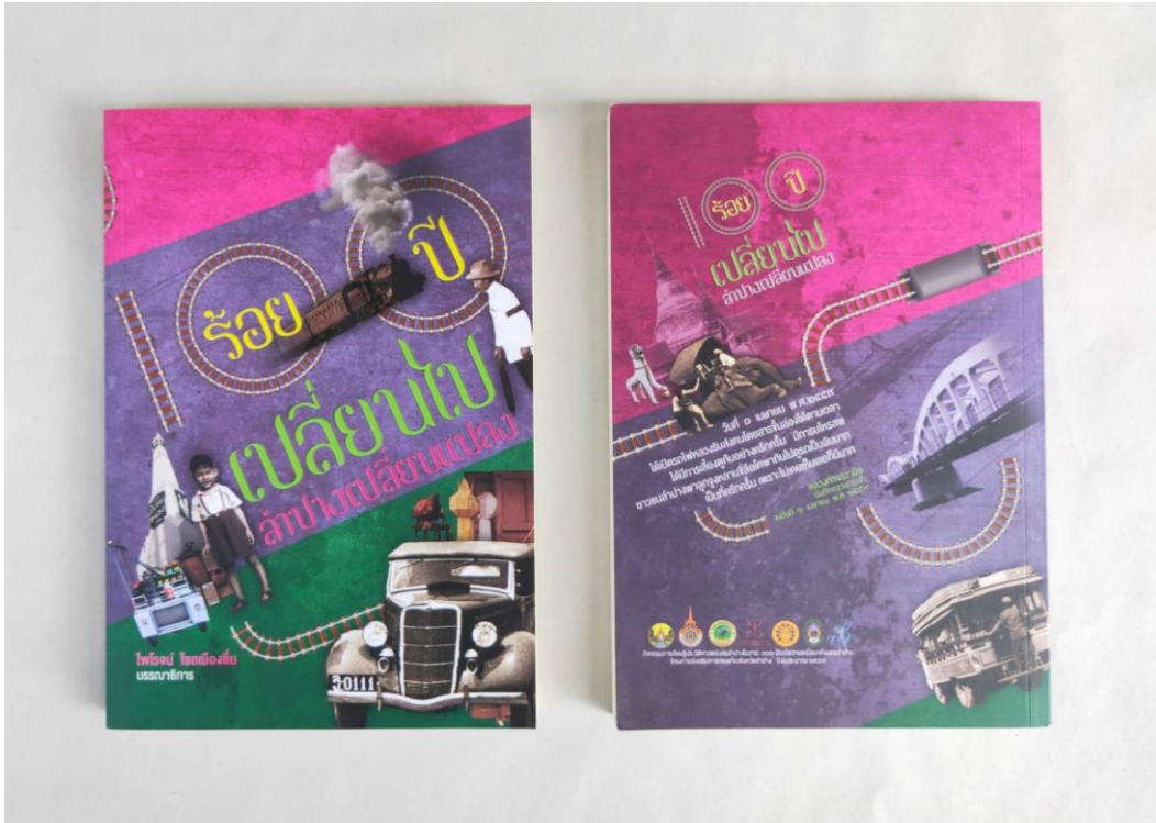
ภาพที่ 4 หนังสือเรื่อง “ร้อยปีเปลี่ยนไป ลำปางเปลี่ยนแปลง” จัดพิมพ์เมื่อปี พ.ศ.2559

5.3 หนังสือเรื่องร้อยปีเปลี่ยนไป ลำปางเปลี่ยนแปลง จัดพิมพ์โดยจังหวัดลำปาง เมื่อ พ.ศ.2559 จำนวน 1,000 เล่มประกอบด้วยบทความที่เกี่ยวกับประวัติศาสตร์ท้องถิ่นลำปางจำนวน 8 เรื่องและมีจำนวน 244 หน้า (ไพโรจน์ ไชยเมืองขึ้น, 2559ค) ประกอบด้วย