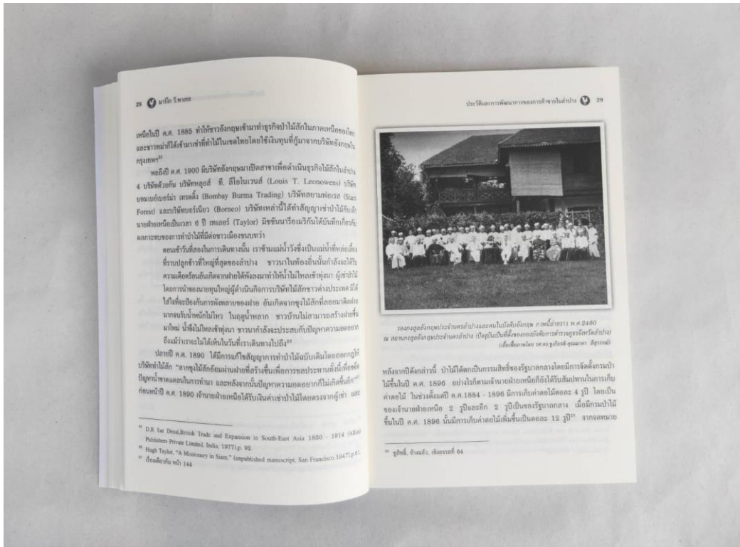
ภาพที่ 5 สถานกงสุลอังกฤษประจำนครลำปาง ภาพถ่ายเก่าหายากที่เผยแพร่เป็นครั้งแรก ในหนังสือลำปางเมื่อหัวหนึ่งศตวรรษ