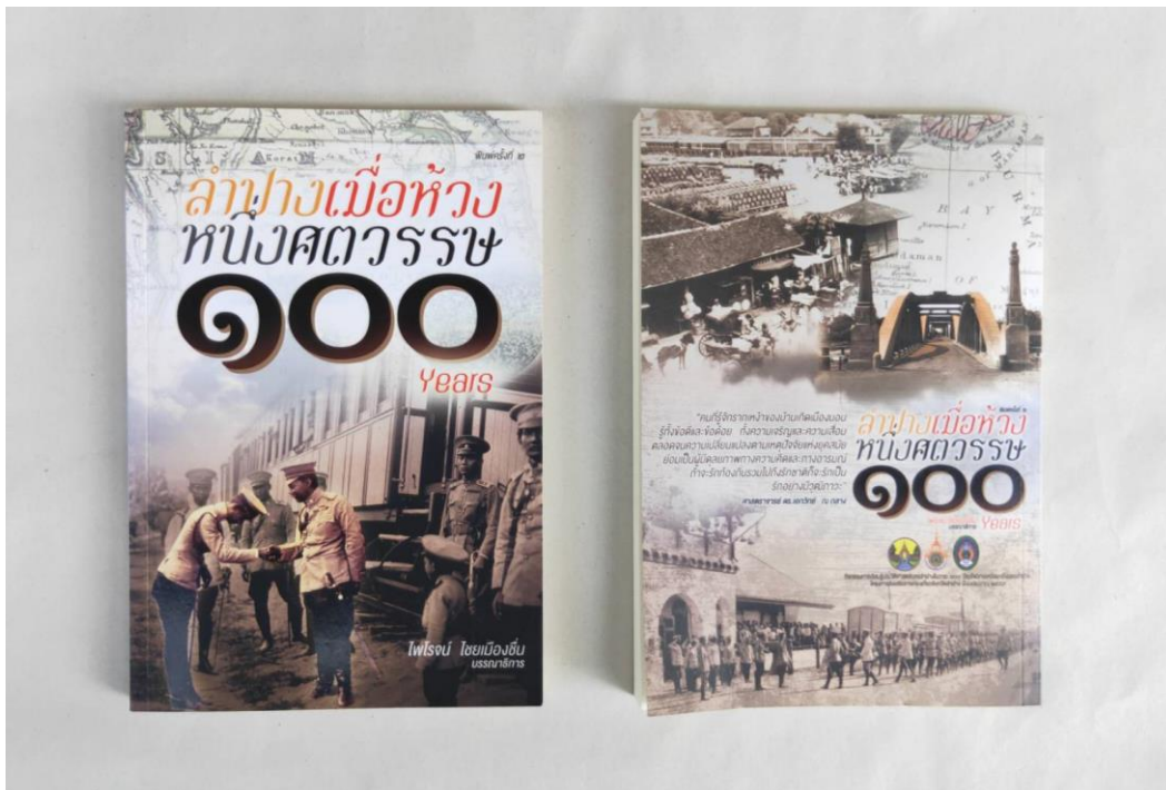
ภาพที่ 2 หนังสือเรื่อง “ลำปางเมื่อห้วงหนึ่งศตวรรษ” ฉบับพิมพ์ครั้งที่ 2 เมื่อปี พ.ศ.2559

เพื่อสร้างสรรค์หนังสือด้านประวัติศาสตร์ท้องถิ่นลำปาง โดยร่วมมือของเครือข่ายนักวิชาการท้องถิ่นให้เป็นเอกสารอ้างอิงทางวิชาการสำหรับเผยแพร่แก่สถาบันการศึกษาในจังหวัดลำปางและประชาชนทั่วไป