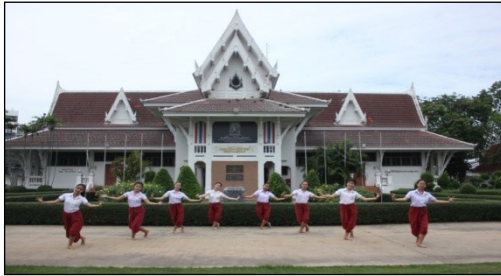
ภาพที่ 11 ทำเนียร้อง: มนุษยศาสตร์สังคมศาสตร์