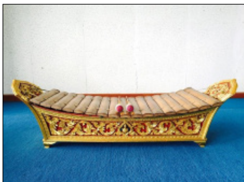
ภาพที่ 2 ระนาดทุ้ม