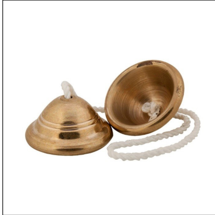
ภาพที่ 7 ฉิ่ง