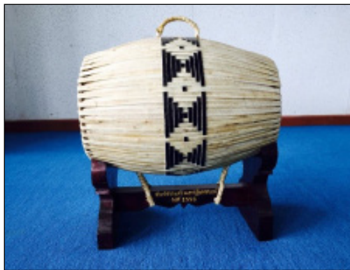
ภาพที่ 4 ตะโพน