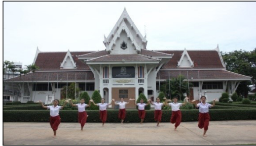
ภาพที่ 32 ทำเนียร้อง: ราชวงศ์จักรี