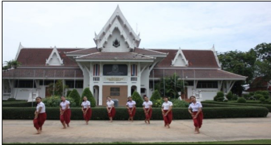
ภาพที่ 23 ทำเนื่อร้อง: กิริยาเพียบพร้อม