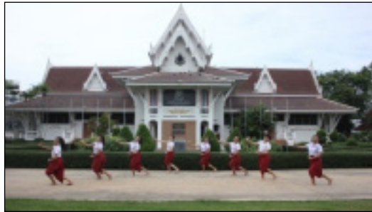
ภาพที่ 9 ท่าเพลงขึ้นรั้ว

ลักษณะการเคลื่อนที่และท่ารำต่อเนื่องในการสร้างสรรค์นาฏศิลป์ไทยเชิงอนุรักษ์ ชุดฉายฉายมนุษยศาสตร์และสังคมศาสตร์ มหาวิทยาลัยราชภัฏนครสวรรค์ จะใช้ผู้แสดงเป็นตัวนาง จำนวน 8 คน ซึ่งลักษณะการรำในบทกลอนจะใช้หลักการรำตีบทในการบรรจจุท่ารำ มีการใช้แม่ทำนานาฏศิลป์ไทยจากรำแม่บท โดยมีลักษณะการเคลื่อนที่และท่ารำต่อเนื่องดังต่อไปนี้