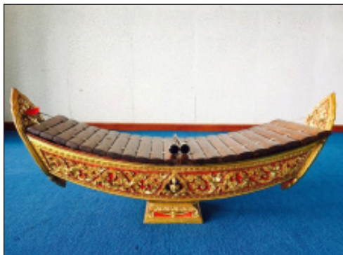
ภาพที่ 1 ระนาดเอก

(นางลักษณ์ ปิยะมั่งคลา, ผู้ถ่ายภาพ, 2565)