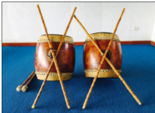
ภาพที่ 5 กลองทัด

(นางลักษณ์ ปิยะมั่งคลา, ผู้ถ่ายภาพ, 2565)