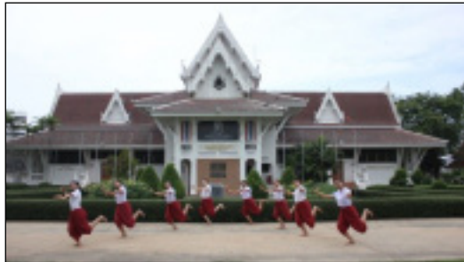
ภาพที่ 26 ทำเนียร้อง: เชื้อมั่นคุณค่าศรัทธาลิ่งดี (นงลักษณ์ ปิยะมั่งคลา, ผู้ถ่ายภาพ, 2565)