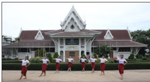
ภาพที่ 28 ทำเนียร้อง: ความเป็นมนุษย์ (นงลักษณ์ ปิยะมั่งคลา, ผู้ถ่ายภาพ, 2565)