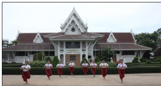
ภาพที่ 31 ทำเนียร้อง: เทิดองค์ภูธร (2565)