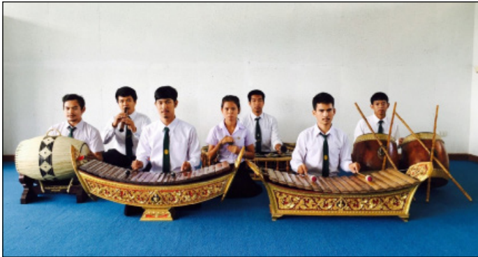
ภาพที่ 8 วงปี่พาทย์เครื่องห้า (นางลักษณ์ ปิยะมั่งคณา, ผู้ถ่ายภาพ, 2565)