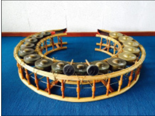
ภาพที่ 3 ฆ้องวงใหญ่