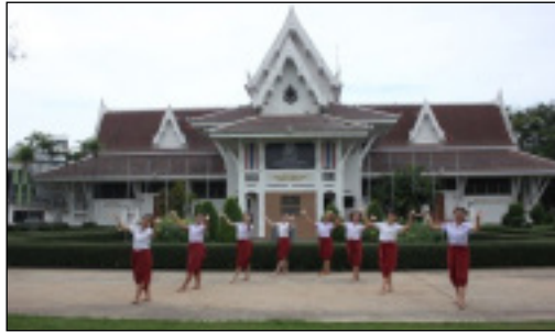
ภาพที่ 41 ทำเนียร้อง: ให้ระบิลเกรียงไกร