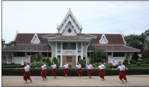
ภาพที่ 14 ทำเนื่อร้อง: สั้งสมสร้างสรรค์