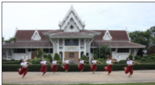
ภาพที่ 10 ท่าเนื้อร้อง: ฉวยฉายเอย