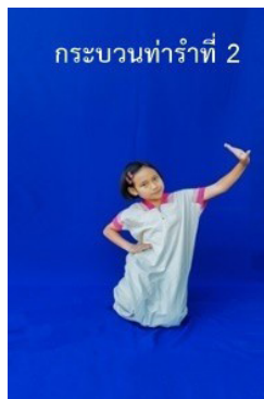
ภาพที่ 14 ท่ารับลักษณะที่ 1