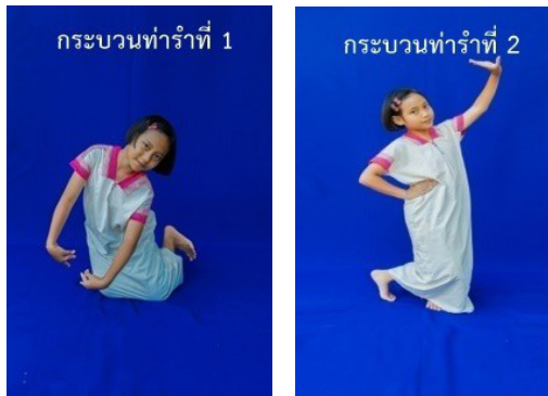
ภาพที่ 17 ท่ารับลักษณะที่ 4 (เกิดศิริ นาคกร, ผู้ถ่ายภาพ, 2563)