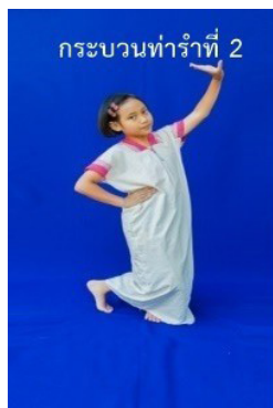
ภาพที่ 15 ท่ารับลักษณะที่ 2