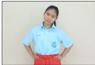
ภาพที่ 1 การเอียงศีรษะ

การเอียงศีรษะ เป็นลักษณะการใช้อวัยวะ ส่วนของศีรษะเฉียงไปด้านซ้ายและด้านขวา