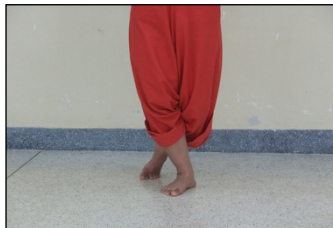
ภาพที่ 11 การก้าวเท้า

การกระดกเท้า เป็นลักษณะการยกเท้าไปข้างหลัง พยายามให้ส้นเท้าชิดกับกันโดยการถีบขาที่กระดกไปข้างหลังมาก ๆ มีลักษณะคือ แบบนั่ง