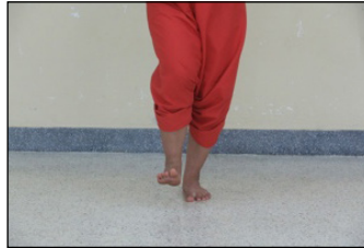
ภาพที่ 6 การย่ำเท้า