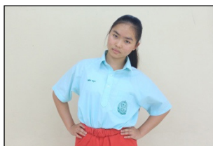
ภาพที่ 2 การกอดไหล่

การกอดไหล่ เป็นลักษณะของการใช้ไหล่ให้ สอดคล้องกับการเอียงศีรษะ เพื่อให้เกิดความความสวยงาม