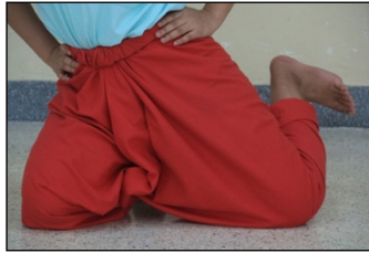
ภาพที่ 10 การกระดกเท้า