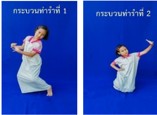
ภาพที่ 16 ท่ารับลักษณะที่ 3