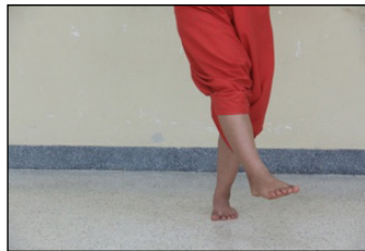
ภาพที่ 7 การเตะเท้า

การย่ำเท้า เป็นลักษณะของการใช้จมูกเท้า วางลงบนพื้น โดยยกส้นเท้าให้ลอยขึ้นจากพื้นเล็กน้อยทำสลับกันทั้ง 2 ข้าง