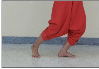
ภาพที่ 12 การก้าวข้าง