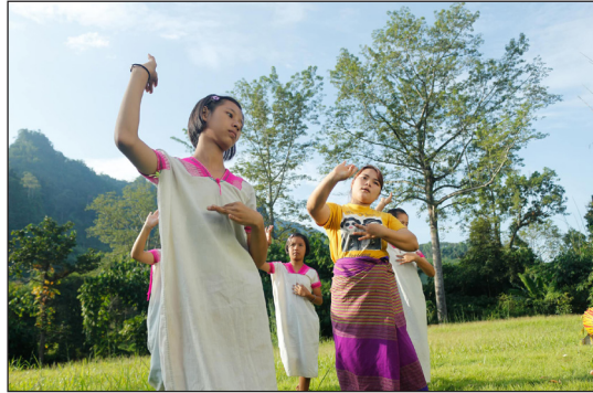
ภาพที่ 18 ฝึกซ้อมการแสดงรำตงผู้ห้อยแห่ก่อนบันทึกวิดีโอ และบันทึกภาพทำรำ (เกิดศิริ นาคกร, ผู้ถ่ายภาพ, 2563)

9. ด้านการแปลแถวพบว่า ในการแสดงมีลักษณะการแปลแถว 2 รูปแบบ ได้แก่ ลักษณะแถวหน้ากระดาน 4 คน ต่อลงไปเป็นตอนลึก 4 คน และลักษณะแถววงกลม 4 วง วงละ 4 คน